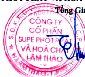
Phạm Thanh Tùng

(Các thuyết minh từ trang 09 đến trang 35 là bộ phận hợp thành của Báo cáo tài chính tổng hợp giữa niên độ này)